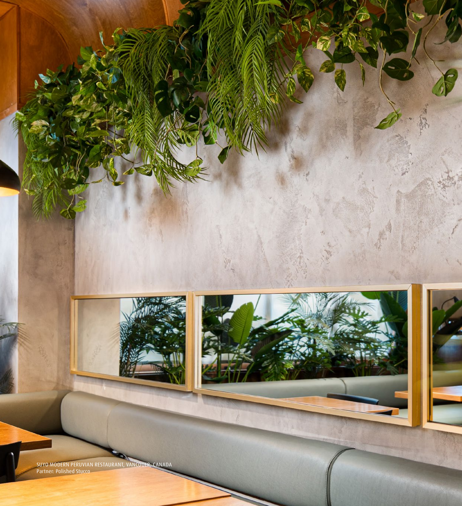
SUYO MODERN PERUVIAN RESTAURANT, VANCOUVER, CANADA Partner: Polished Stucco